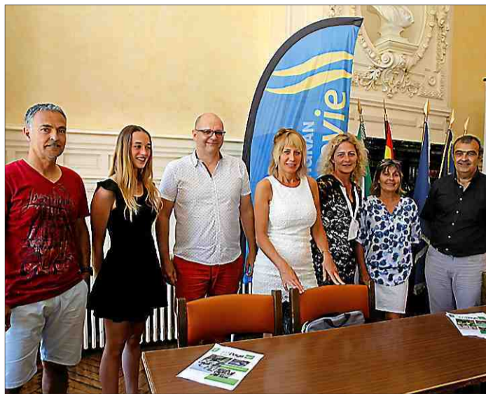
Des partenaires réunis autour « de valeurs partagées ».

Programme recentré Si, en 2017, Frontignan avait accueilli avec succès deux temps des Fitdays, en 2018, la manifestation se recentre sur une seule journée avec pour débiter une matinée dédiée aux enfants, qui pourront s'initier à la pratique du triathlon et de ses disciplines enchaînées sous une forme ludique et non compétitive. Puis, à 12 h 30, dans le prolongement de cette animation, les jeunes coureurs pourront prendre part à la finale régionale Occitanie 2 des enfants. L'après-midi (départ fixé à 15 h) place au "Triathlon pour tous" avec un parcours de type Small (750 mètres de