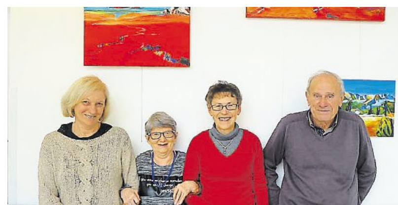
Les résidents de la Plumelière ont accueilli les peintres de l'association.

L'Atelier du Verger de Saint-Erblon est une association de peintres amateurs. Pour égayer les murs de la résidence de la Plumelière, un établissement pour personnes âgées de la commune, une trentaine de tableaux des peintres de l'association y sont exposés. Le but de cette exposition