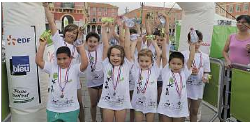
Des médailles et de la joie pour les participants à la journée Fitdays-MGEN, hier après-midi place Masséna.